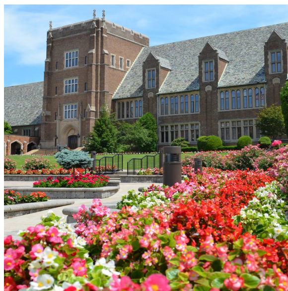
El hermoso campus de la Universidad de Mercyhurst

Alojamiento para estudiantes y chaperones se proporcionarán en la Universidad de Mercyhurst. Los estudiantes compartirán una habitación por dos con baño privado. Cada chaperone tendrá su propio dormitorio con baño privado. Se proporcionará ropa de cama (sábanas, fundas de almohadas, toallas y toallitas).